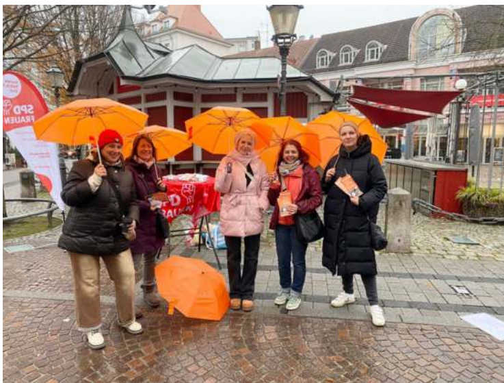
SPD Frauen Karlsruhe am Stand bei Orange Day 2025

Am 27. November 2025 beteiligten sich die SPD Frauen Karlsruhe im Rahmen der internationalen Orange Days mit einer Aktion in der Karlsruher Fußgängerzone. Der Orange Day macht weltweit auf Gewalt gegen Frauen und Mädchen aufmerksam und setzt ein sichtbares Zeichen gegen Diskriminierung und strukturelle Ungleichheit.