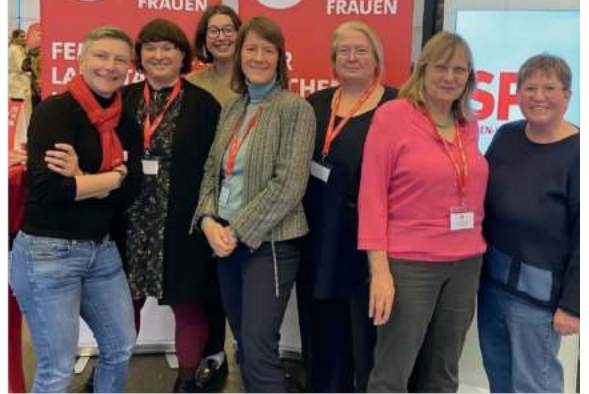
LPT Offenburg, 2024