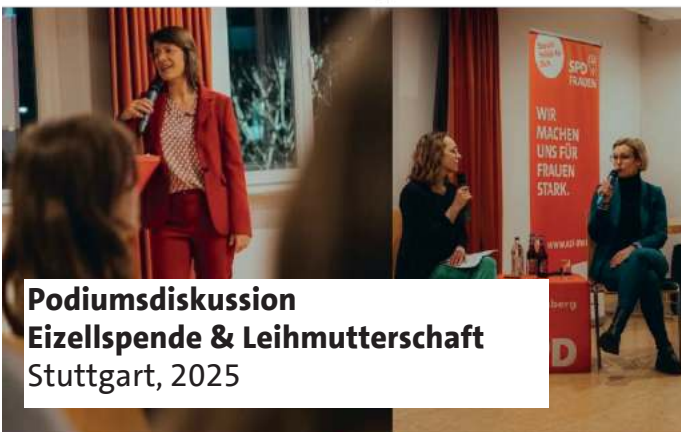
Podiumsdiskussion Eizellspende & Leihmutterchaft Stuttgart, 2025