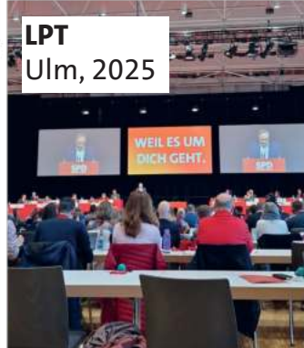
LPT Ulm, 2025