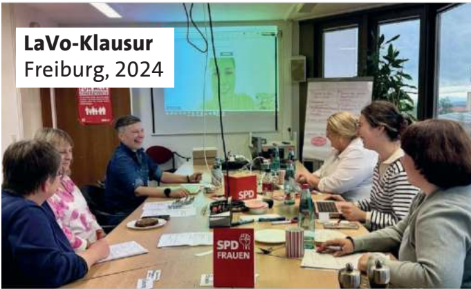
LaVo-Klausur Freiburg, 2024