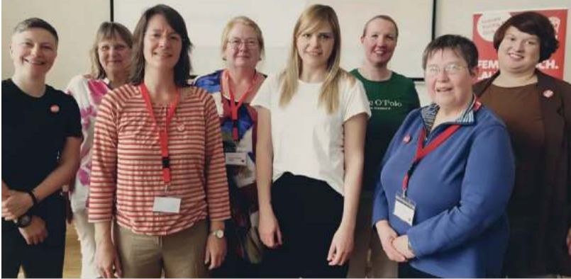
Neu gewählter SPD-Frauen LaVo Landesdelegiertenkonferenz Stuttgart, 2024