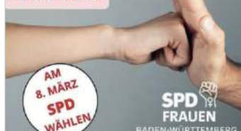
LPT Ulm, 2025

WEIL SCHUTZ VOR GEWALT POLITISCHE ENTSCHEIDUNGEN BRAUCHT