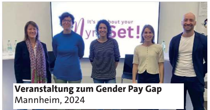
Veranstaltung zum Gender Pay Gap Mannheim, 2024