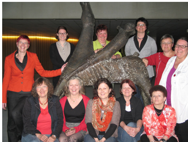
Teilnehmerinnen einer Landesvorstandssitzung

Der ASF-Landesvorstand tagt in der Regel monatlich. Regelmäßig laden wir auch zu Landesausschusssitzungen ein, die meist in den Kreisverbänden stattfinden. Im Berichtszeitraum waren wir zu Gast in Mannheim, Pforzheim, Baden-Baden, Offenburg und Ulm. Dabei informierten wir uns z.B. über ein Gründerinnenzentrum, die Pforzheimer Schmuckindustrie, Frauen beim SWR, ein Heim für obdachlose Frauen und über einen Mädchen- und Frauenladen. Außerdem haben wir uns zu zwei Klausurtagungen getroffen: Im März 2012 in Schwäbisch Hall und im Februar 2013 in Bühl. Bei aktuellen Anlässen finden immer wieder Telefonkonferenzen statt. Über den Armuts- und Reichtumsbericht der Bundesregierung referierte Hilde Mattheis in einer Sitzung des ASF-Landesvorstands.