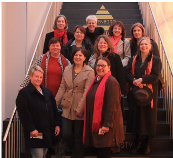
Landesausschuss in Pforzheim

Öffentlichkeitsarbeit betreiben wir zum einen mit unserer Homepage http://asf-bw.de . Dort finden sich Termine, Pressemitteilungen und Veranstaltungsberichte, aber auch Positionspapiere stehen zum Download bereit. Die Ausgaben unserer Zeitschrift „ASF aktuell“ erscheinen jetzt mit einem Schwerpunktthema. Mit dem Heft „Frauen und Wirtschaft“ haben wir die Jahres-Kampagne der Landes-SPD begleitet. Alle Ausgaben des ASF aktuell sind auch auf der Homepage nachzulesen. Zum 40jährigen Jubiläum der baden-württembergischen ASF ist eine Broschüre erschienen.