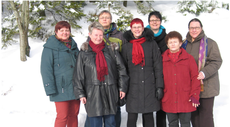
Klausur 2013 in Bühl

Unser vorrangiges Ziel ist es, die Gleichstellung von Frauen und Männern in allen Bereichen zu verwirklichen. Diesem Ziel sind wir mit der Änderung des Kommunalwahlrechts einen Schritt näher gekommen. Der Landtag hat im Frühjahr 2013 die Änderung des Kommunalwahlrechts beschlossen. Dass dort nun eine paritätische Besetzung der Kommunalwahllisten als Soll-Vorschrift thematisiert ist, werten wir als ersten Schritt in Richtung einer verbindlichen Regelung zur Erhöhung des Frauenanteils in den Parlamenten in Baden-Württemberg. Weitere müssen folgen. Dazu gehört auch eine Reform des Landtagswahlrechts, die wir vorantreiben wollen.