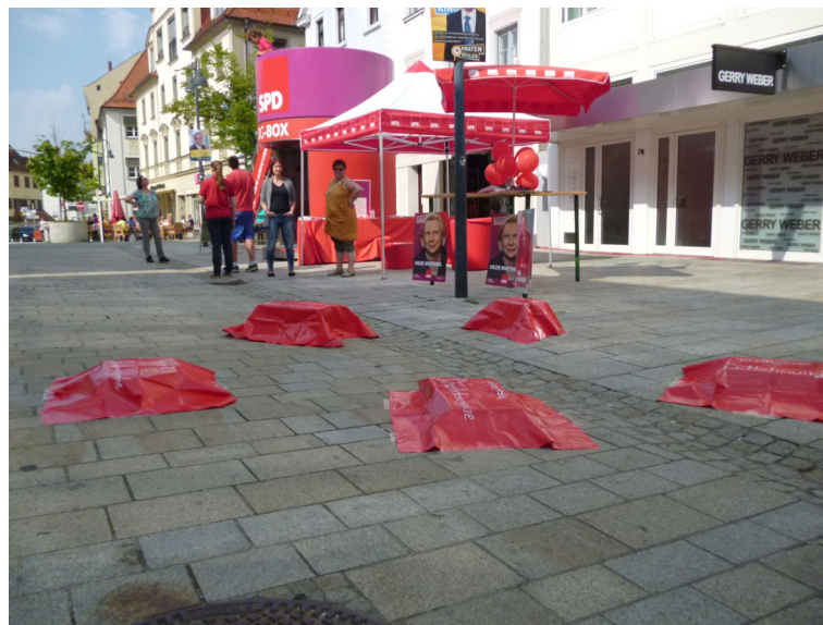
„Stolpersteine“ in Ehingen